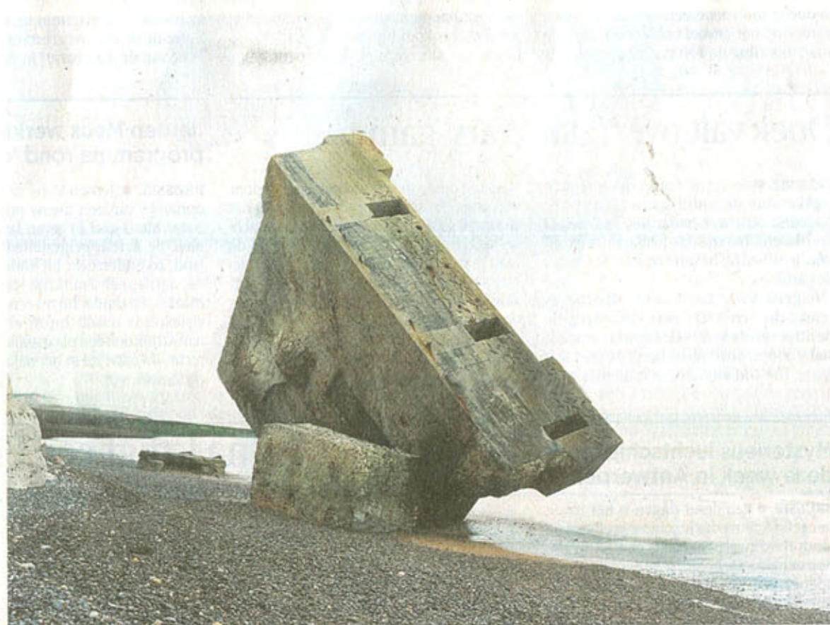
■ The Bunker #1 van Jan Kempnaers.