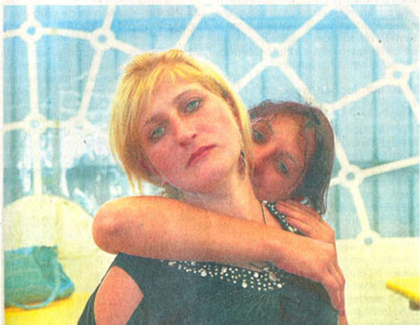
■ Two friends, Vladivostok, Russia van Philippe Herbet.

Belgen verkennen de grens tussen het objectieve en subjectieve in Bozar-expo 'Beyond the Document'