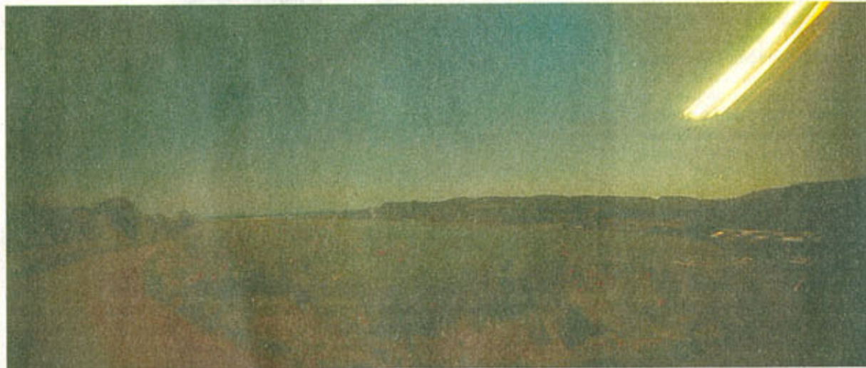
■ Dudelange II van Felten Massinger.